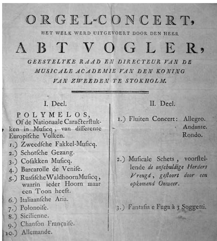
Programma van een concert door Vogler met het stuk 'Polymelos'