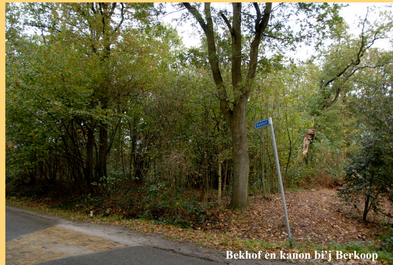
Bekhof en kanon bi'j Berkoop